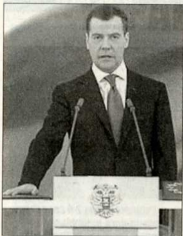
Дмитрий Медведев вступил в должность Президента Российской Федерации. В Большом