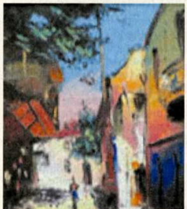
Т. Микоян. «Уголок старого Тифлиса». 2004.

Ваши вопросы можете присылать по адресу: 344019, Ростов-на-Дону, ул. 14-я линия, 74/1, или по тел./факсу (863) 283-06-81, либо на наш e-mail: nnao@mail.ru.