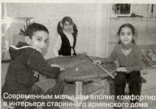
Современным малышам вполне комфортно в интерьере старинного армянского дома

Зато «мужская» часть экспонатов концентрирует внимание посетителей на совершенно другой теме: на том, как много и усердно готовы были трудиться представители сильной половины армянского общества, чтобы обеспечить своим любимым, своим семьям такую достойную, благополучную жизнь. В этой части экспозиции пред-