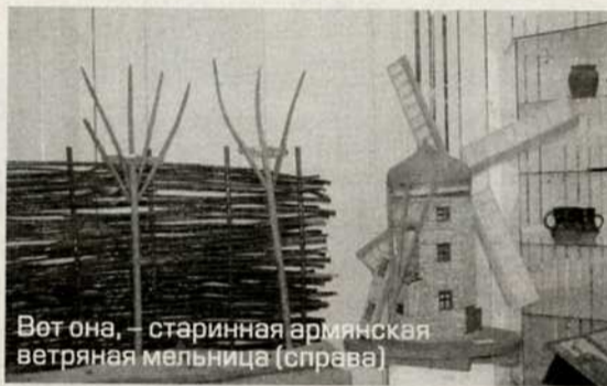
Вот она, – старинная армянская ветряная мельница (справа)

Другими словами, эта выставка только на первый взгляд кажется излишне скромной и информационно мало насыщенной. По-настоящему заинтересованные в знакомстве, а, может быть, и в очеред-