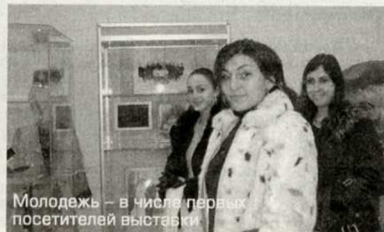
Молодежь – в числе первых посетителей выставки