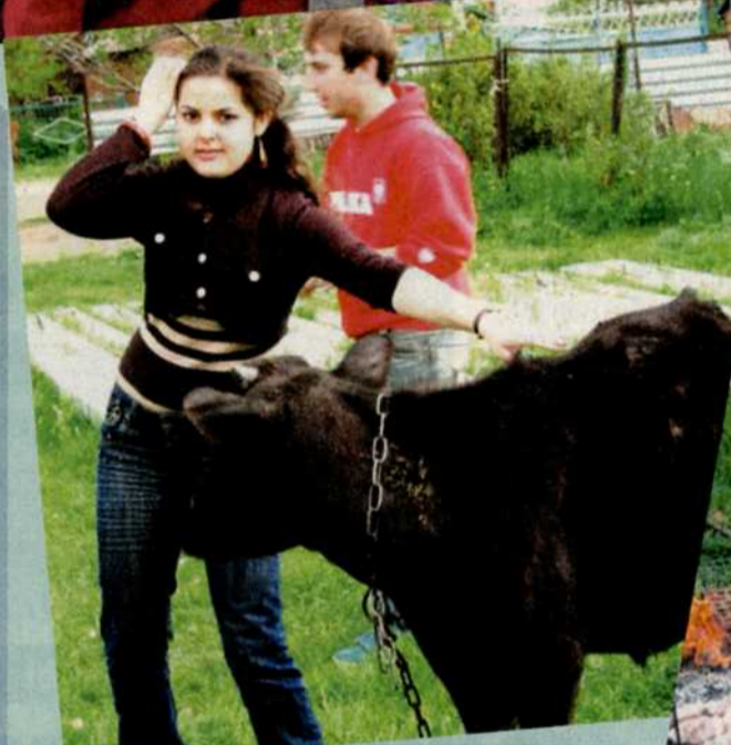
Привела еще одного помощника