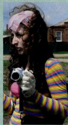
Наш штатный папарацци