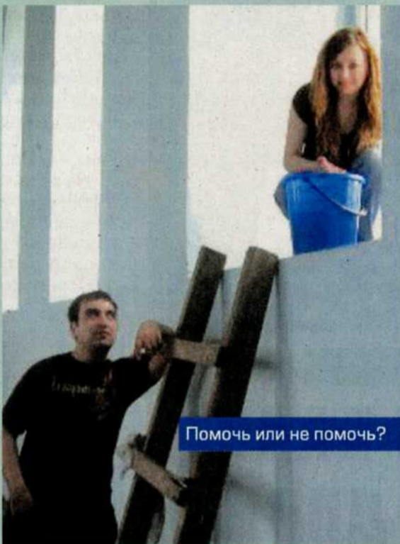
Помочь или не помочь?