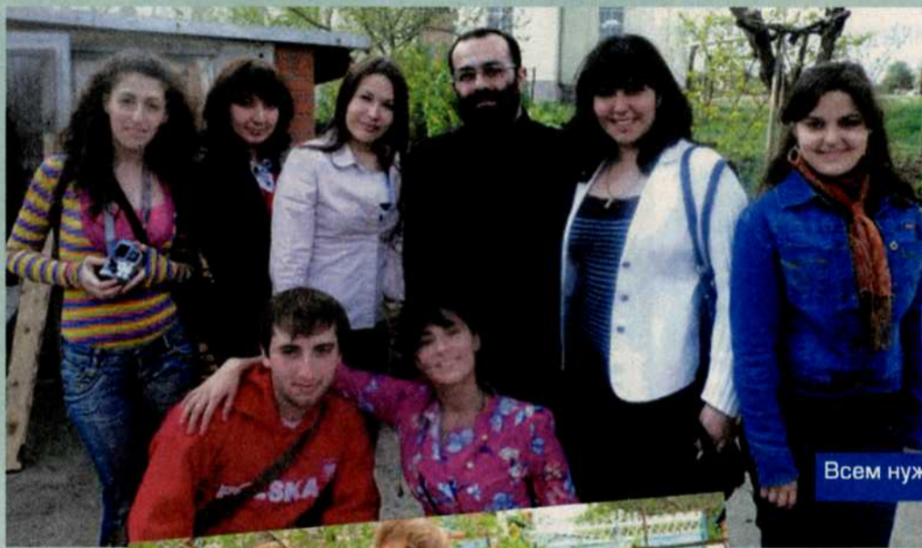
Всем нужна духовная поддержка