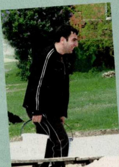
Почему я водовоз?

МОЛОДЕЖНАЯ ОРГАНИЗАЦИЯ "НОВО-НАХИЧЕВАНСКОЙ-НА-ДОНУ АРМЯНСКОЙ ОБЩИНЫ" ОРГАНИЗОВАЛА И ПРОВЕЛА СУББОТНИК В БОЛЬШИХ САЛАХ. СИЛАМИ МОЛОДЕЖИ БЫЛА ПРОВЕДЕНА УБОРКА В ХРАМЕ СУРЬ АСТВАЦАЦИН И НА ПРИЛЕЖАЮЩЕЙ ТЕРРИТОРИИ. СУББОТНИК ЗАВЕРШИЛСЯ ПИКНИКОМ НА ПРИРОДЕ.