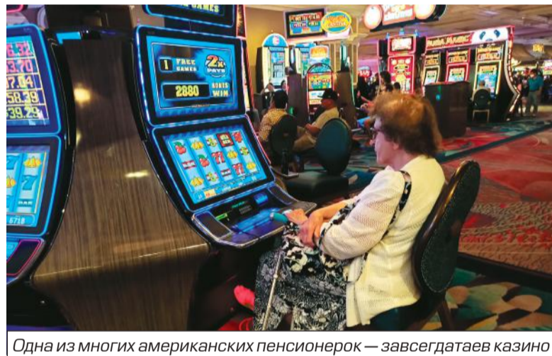
Одна из многих американских пенсионерок — завсегда в казино

«Зона 51» используется в официальных документах ЦРУ под различными кодовыми названиями. Согласно официальным данным, здесь разрабатываются экспериментальные летательные аппараты и системы вооружения. Еще во времена холодной войны советские спутники-шпионы фотографировали «Зону 51». Иначе говоря, раскрыли и сделали фотоснимки. Однако по ним нельзя было получить существенной информации о полигоне: видны только непримечательные базы, ангары и сухие озера. По неофициальным данным, основная часть рабочей