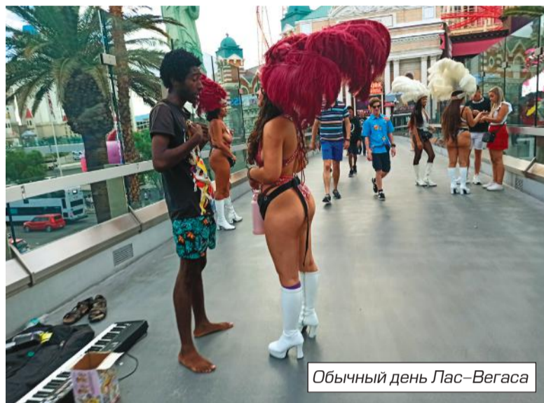
Обычный день Лас-Вегаса

на территории строительства дамбы проституцию, азартные игры, продажу спиртных напитков и пр. Все эти законы хоть и уберегли рабочих от криминала и разбоя, но не от гибели. Строительство велось в тяжелых условиях. Часть работ проводилось в тоннелях, где рабочие страдали от избытка угарного газа, из-за чего одни стали инвалидами, другие погибли от пневмонии. Кстати, первым погибшим на строительстве дамбы был топограф Джордж Тирни. Не от пневмонии. Он утонул в водах Колорадо задолго до начала возведения плотины в