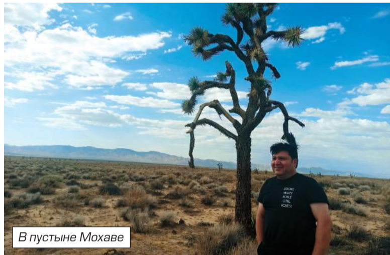
В пустыне Мохаве