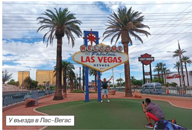
У въезда в Лас–Вегас

Итак, в полночь, прибыв в аэропорт Лас–Вегаса, где уже ждал меня Маркар, я тут же оказался в казино. По всему маршруту от трапа до выхода из здания аэропорта — бесконечные игровые автоматы. «Welcome to Las Vegas!» гласит надпись, играя неоновыми красками. В этот поздний час вотчина почившего миллиардера Керка Киркоряна как раз оживает. Весь город играет теми же неоновыми красками, что и мониторы игровых автоматов в аэропорту. Игнорируя весь этот ночной гламур, мы отправились в один из лучших в городе отелей Bally's, где я снова столкнулся с казино и многочисленными «однорукими бандитами». Кстати, Bally's был построен Керком Киркоряном в конце 1960–х годов и назывался много лет MGM Grand. Но уже