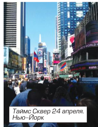
Таймс Сквер 24 апреля. Нью-Йорк

Но не буду о грустном. В целом Брайтон-Бич вполне комфортный район для жизни и работы, хоть я и считаю, что работать нужно за пределами района ради английского и коммуникации с другими представителями народов многонационального Нью-Йорка. Что касается армян, то у этой общины нет определенного района города, где бы армя-