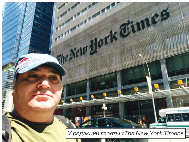
У редакции газеты «The New York Times»