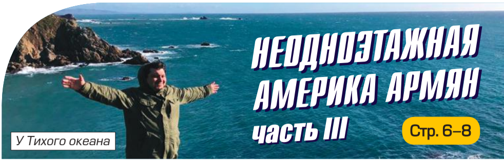
У Тихого океана