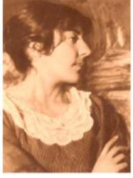
Мариэтта Сергеевна Шагинян (1888–1982)

Южный федеральный университет Ростовский областной музей краеведения Ростовская региональная общественная организация «Нахичеванская-на-Дону армянская община» Администрация Мясниковского района Ростовской области