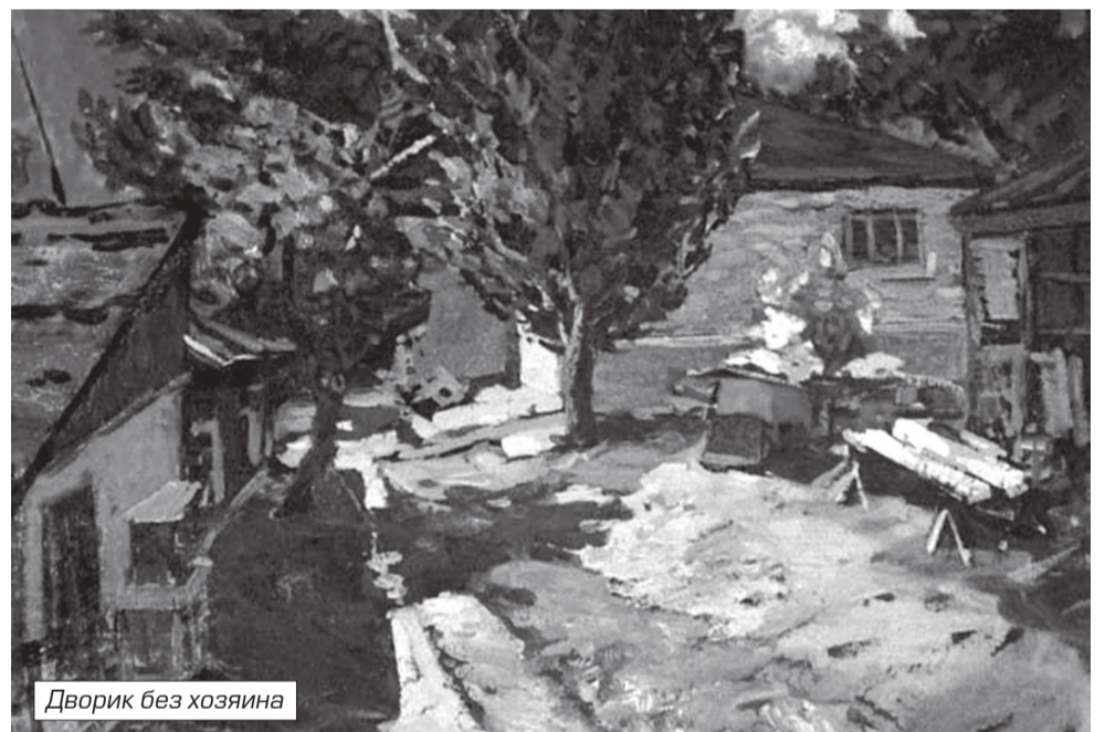
Дворик без хозяина

В своем творчестве Хашхаян касался и армянской тематики, изображая как Мясниковский район (он родился в селе