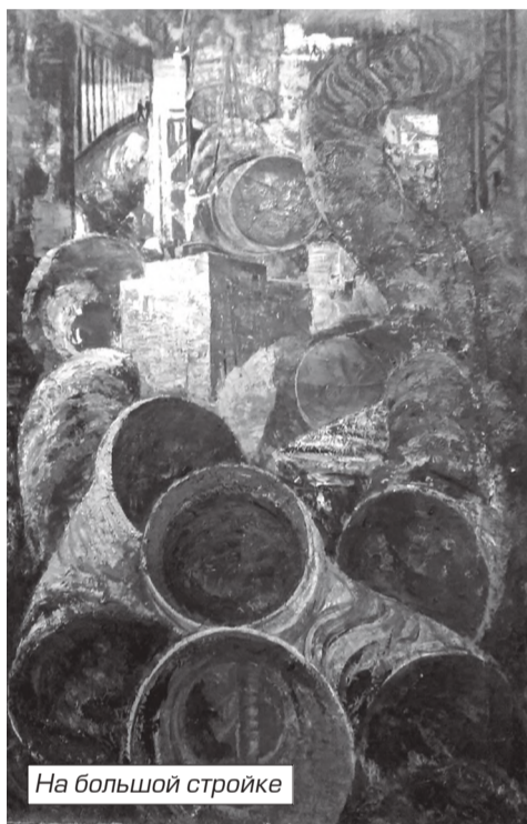
На большой стройке