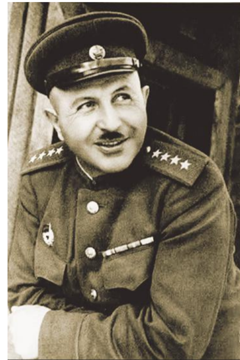
Иван Христофорович Баграмян