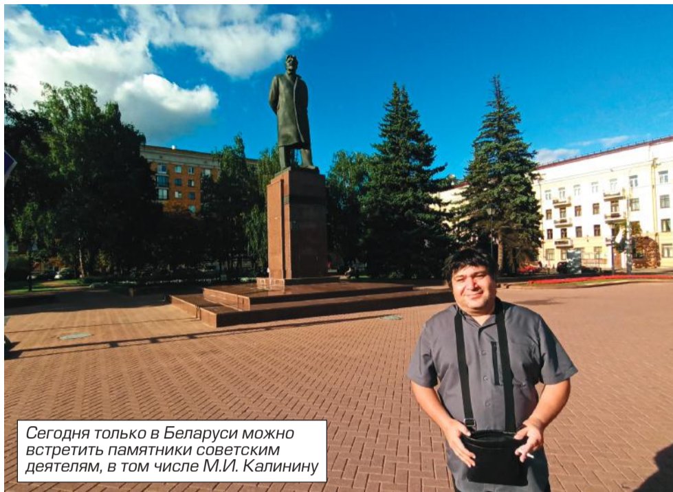
Сегодня только в Беларуси можно встретить памятники советским деятелям, в том числе М.И. Калинин