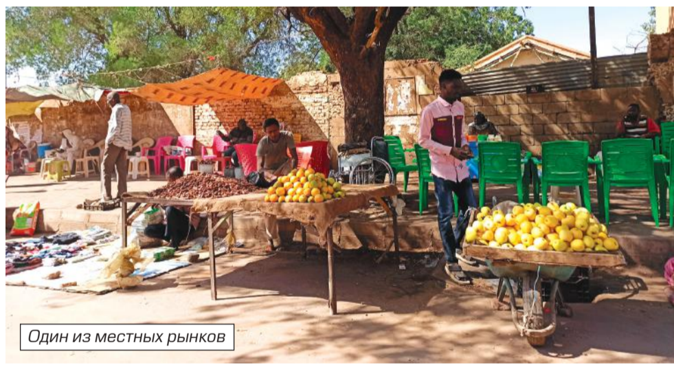
Один из местных рынков