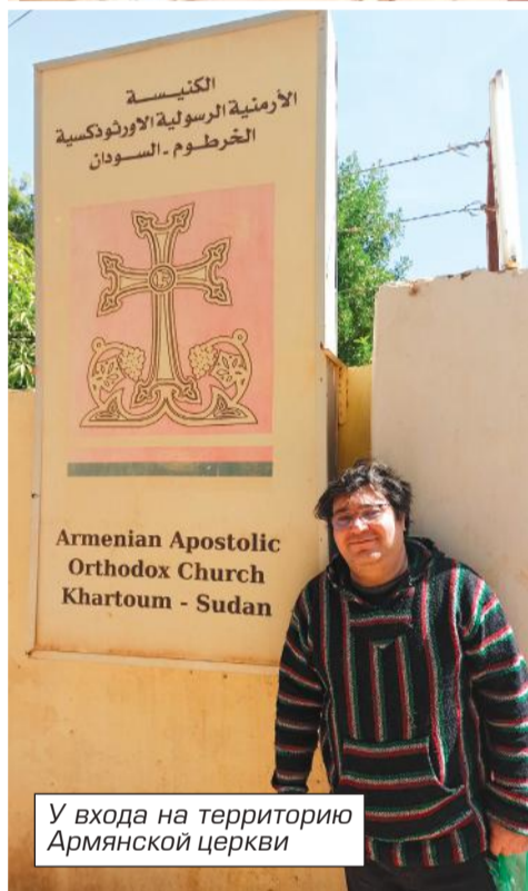
У входа на территорию Армянской церкви

христиански, женщин обязывали носить хиджабы, дети не могли учиться в своих школах. Родителям приходилось либо платно обучать деток в армянской школе, либо бесплатно, но в мусульманских медресе. Коптам в Судане приходилось несладко. Был и такой нашумевший случай. В феврале 1991 г. пилот-копт, работавший на суданских авиалиниях, был казнен за незаконное хранение иностранной валюты. Перед казнью ему предложили амнистию и деньги, если он примет ислам. Пилот отказался. Тысячи людей пришли на его похороны, а казнь была воспринята как предупреждение многими коптами, которые начали бежать из страны.