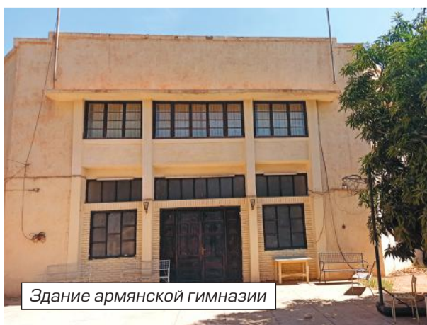
Здание армянской гимназии

исламу. И сделать это было куда проще, чем если бы пытались исламизировать армян. В отличие от них, копты — арабоязычный народ, как и мусульмане Судана. Используют арабскую вязь. Мало кто из коптов говорит на родном языке. Нынче он используется только в богослужении, как и письмо. Армяне же в быту используют родной язык, письмо, литературу. Это их и спасло. Что касается коптов, только в 2005 г. они получили свободу вероисповедания в Судане. На протяжении столетия им не позволялось молиться по-