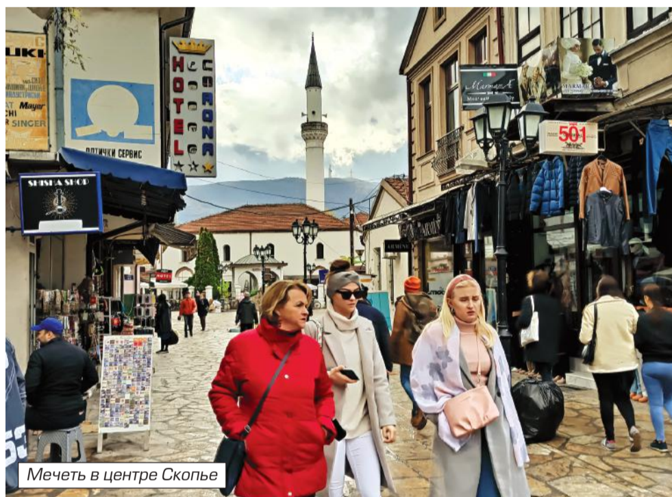
Мечеть в центре Скопье

ях обычно говорят «Чем бы дитя ни тешилось...». А Македония, как вы понимаете, дитя на руках «Старушки-Европы».