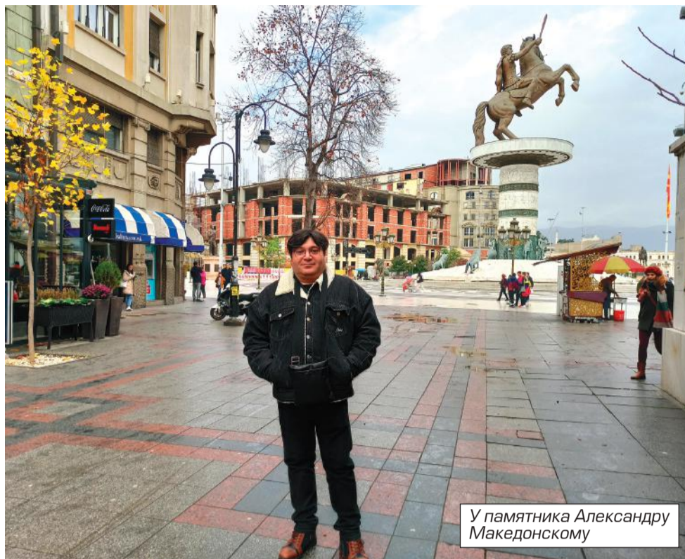
У памятника Александру Македонскому

В Македонию я приехал всего на несколько дней. Страну посмотреть, по столице прогуляться, с местными армянами познакомиться. Мне посчастливилось снять квартиру в самом центре города с видом на памятник «Всадник на коне». Такой luxury room стоил бы колоссальных денег в столице любого другого европейского государства. В Скопье же снятая квартира обошлась в сущие копейки — чуть более 50 евро в сутки. Македония одна из беднейших европейских стран. Оттого и цены в стране вполне приемлемые. К тому же мне на транспорт расходуется не пришлось. Город маленький, население едва дотягивает до полумиллиона. А если выйти прогуляться по Скопье, то может показаться, что памятников здесь куда больше, чем людей. Я не знаю, с чем связана любовь властей к памятникам всяко-разным личностям, не имеющим отношения к Македонии, но наставлены они везде. Их тысячи — от античных персонажей Рима и Греции до современных и даже ныне здравствующих ученых, поэтов, художников. Видимо, с обретением независимости мэрии Скопье ничего другого не пришло в голову, кроме как натянуть всюду памятники, чтобы привлечь туристов. В таких случа-