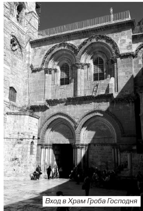
Вход в Храм Гроба Господня

Эту лестницу называют еще символом христианского разделения. Говорят, что как-то, в девяностые годы минувшего столетия, эту лестницу вытащили через окно