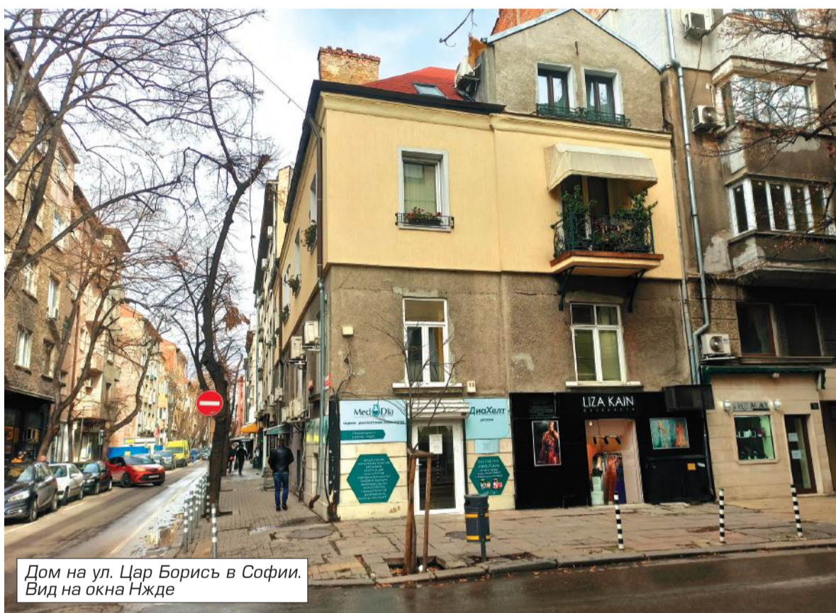
Дом на ул. Цар Борисъ в Софии. Вид на окна Нжде

Будучи гражданином Российской империи и русским офицером, Нжде был грозой для турок. Он героически проявил себя в Первой мировой на стороне России против Турции. За что был награжден Царской Россией пятью орденами