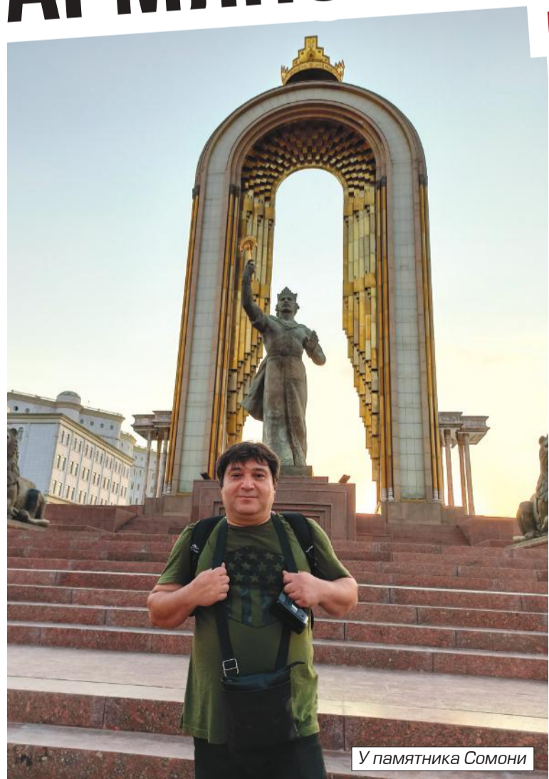
У памятника Сомони

так и современной. Одни только имена чего стоят — Ширази, Айни, Рудаки, Балхи, Джами и т.д. Одна только Государственная библиотека! Она располагает более чем двумя миллионами томов, а также двумя тысячами рукописей, часть из которых старше 900 лет. Это книгохранилище носит имя величайшего персидского поэта Х в. Фирдоуси. Ведь на протяжении тысячелетий понятия «таджикский язык» с его кириллической азбукой не существовало. То, что сейчас принято называть «таджикским языком», еще чуть более 100 лет назад считалось одним из диалектов персидского языка, именуемым в ираноязычном мире языком дари. Впрочем, язык таджиков Афганистана до сих пор так и называется. Новая же литературная норма «таджикский язык» ( забони тоҷикӣ ) разработана относительно недавно группой литераторов во главе с Садриддином Айни и основана на северо-таджикских говорах. Поэтому если говорить не о персидском, а конкретно о термине «таджикский язык», то он зародился в 20-х гг. прошлого столетия в соответствии с языковой политикой СССР.