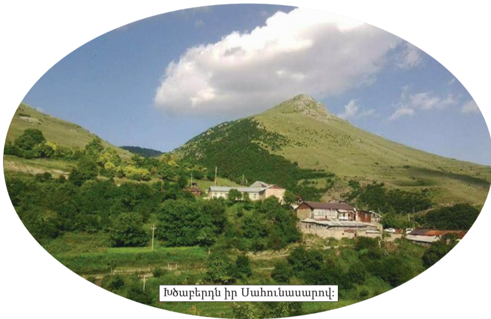
Խծաբերդն իր Սահունասարով:

— Բալաս, մոտս էրքան աս, էսօր աշխատավարձ կստանամ: Ասաց՝ մամ, ուզում ես էլ էլ մի տուր, մոտդ պահիր: