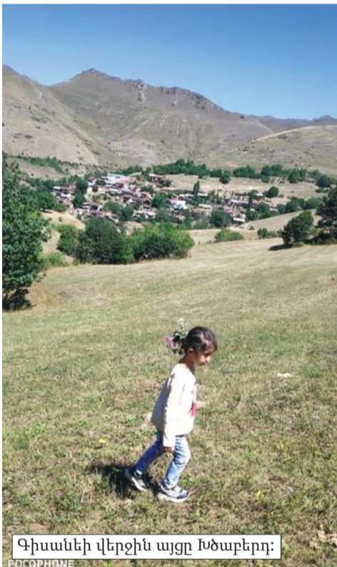
Գիսանեի վերջին այցը Խծաբերդ:

Վահագն աշխարհ է եկել առաջնեկի իրավունքով՝ որպես գեղեցիկ սիրո ծնունդ: Նրա առաջին ճիշտ աշխարհը գունափոխվել ու իմաստափոխվել է ինձ համար: Նա իմ ուժի, զորության, դիմադրողականության, կենսունակության աղբյուրն էր, ապրելու արդարացումը: