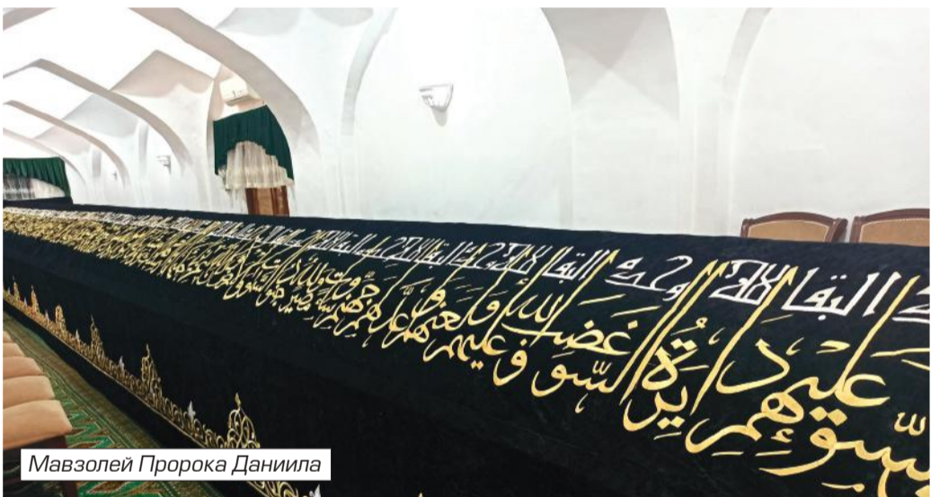
Мавзолей Пророка Даниила