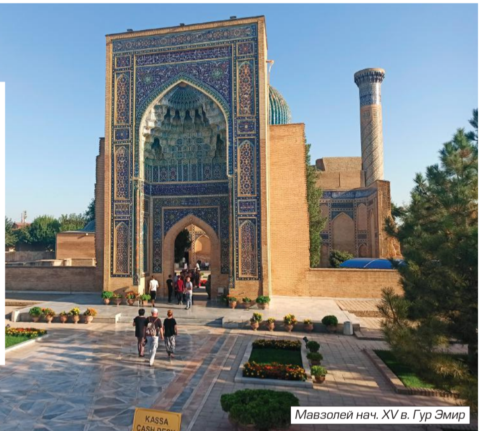
Мавзолей нач. XV в. Гур Эмир

букетом цветов. Он подбежал к Азнавuru, вручил ему цветы и начал было произносить заранее заготовленную приветственную речь на французском языке. Азнавур поблагодарил мальчика, поцеловал в темячко и спросил: