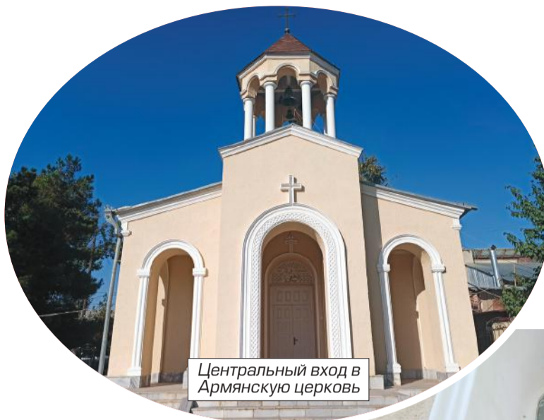
Центральный вход в Армянскую церковь

Внутренние убранства медресе не менее впечатляют. И в них тоже мозаики, выполненные синим камнем и золотом, майолик, на котором изображены фигуры людей, животных и растений. Ну и арабская вязь, естественно, по всем фасадам и колоннам как внутри, так и снаружи