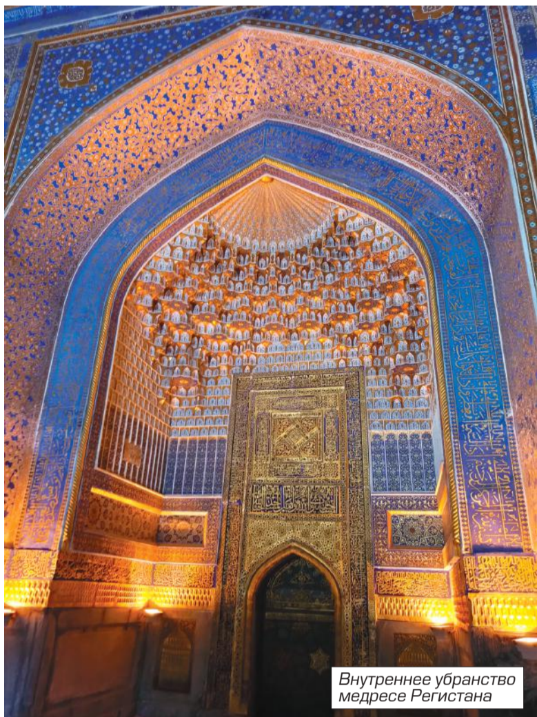
Внутреннее убранство медресе Регистана