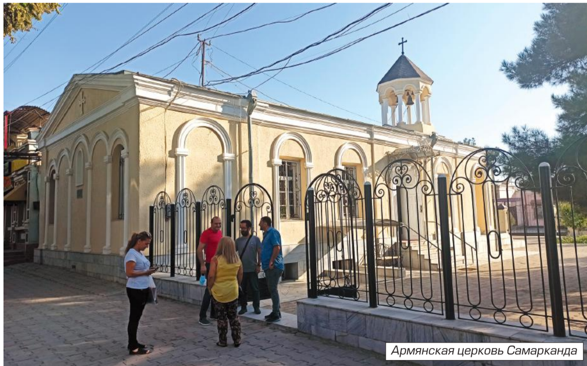
Армянская церковь Самарканда