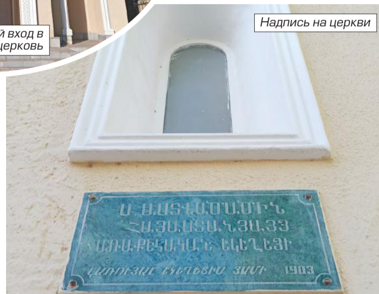
Надпись на церкви

Внутренние убранства медресе не менее впечатляют. И в них тоже мозаики, выполненные синим камнем и золотом, майолик, на котором изображены фигуры людей, животных и растений. Ну и арабская вязь, естественно, по всем фасадам и колоннам как внутри, так и снаружи