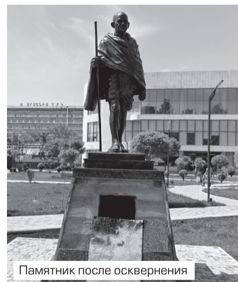
Памятник после осквернения

его ошибки, образумить. Например, известно, что Ганди дважды писал письма Гитлеру, обращаясь к нему со словами «Дорогой друг, Гитлер». Индиец искренне полагал, что любовью и уважением можно одолеть зло. Но стоит ознакомиться с содержанием письма, как становится понятен мирный посыл Ганди. В Израиле или России могло бы кому прийти в голову снести памятник Ганди из-за этого