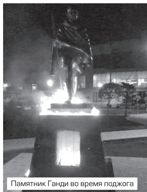
Памятник Ганди во время поджога