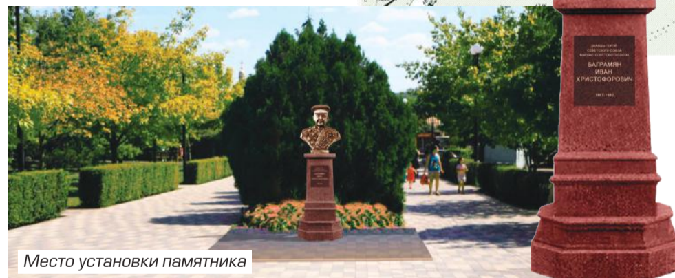
Место установки памятника

Но во время Великой Отечественной войны Баграмян ярко проявил себя как полководец. Именно Баграмян осуществил план ликвидации немцев в Ельце под Москвой в 1941 году. За это 27 декабря 1941 года получил звание генерал-лейтенанта, а уже 28 декабря возглавил штаб Юго-Западного направления.