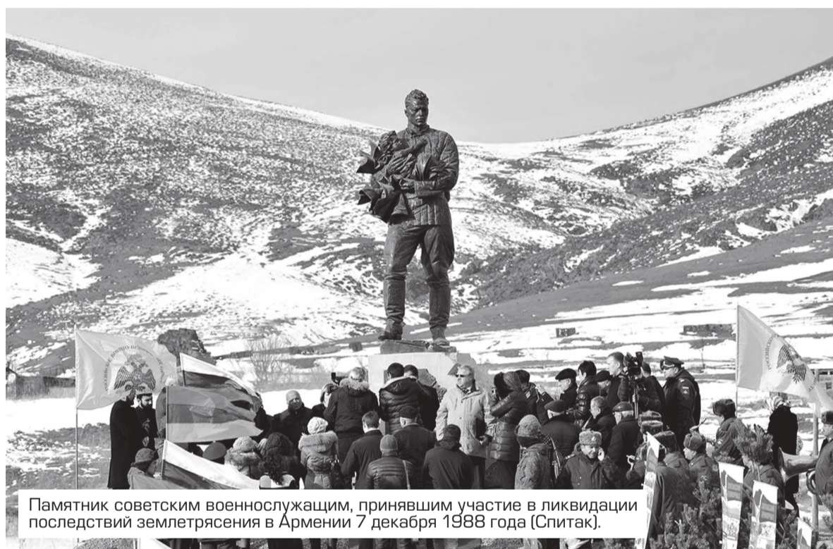
Памятник советским военнослужащим, принявшим участие в ликвидации последствий землетрясения в Армении 7 декабря 1988 года (Спитак).

Ликвидация последствий Спитакского землетрясения впервые в истории СССР приняла международный характер. Михаил Горбачев, узнав о трагедии, прервал свой международный визит и вылетел в