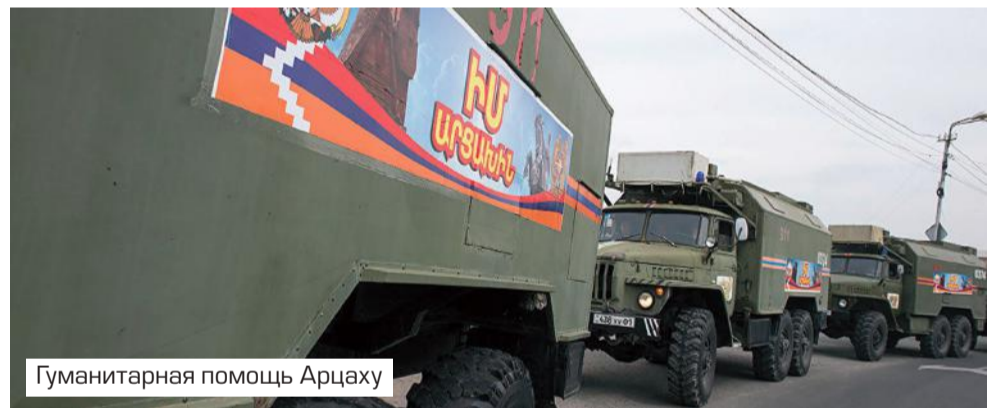
Гуманитарная помощь Арцаху