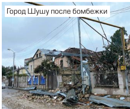
Город Шушу после бомбежки