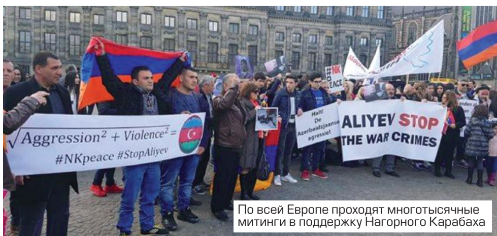
По всей Европе проходят многотысячные митинги в поддержку Нагорного Карабаха