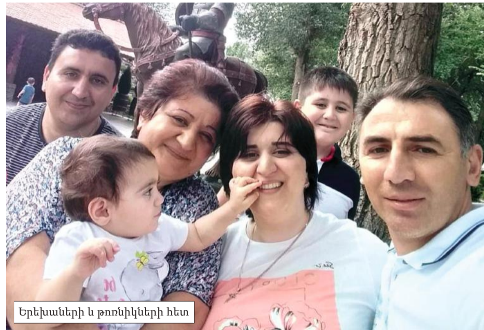
Երեխաների և թոռնիկների հետ

լավ երգում, որին ես չեմ տեսել, զոհվել է Հայրենական պատերազմում, Ռուստովի համար մղված մարտերում: Ինչ իմանար, որ թոռնուհին տարիներ հետո որպես Բաքվի փախստական, հանգրվան է գտնելու հենց այն քաղաքում, որի համար ինքն է զոհվել: Հա յի բախտ... — ծիծաղում է ու շարունակում, — ճակատագիրն ինձ հասցրել է այստեղ, որ պապիս գերեզմանին հորովել երգեմ: