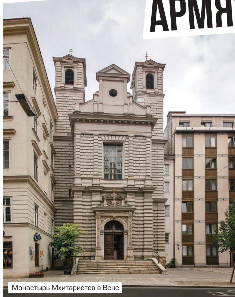
Монастырь Мхитаристов в Вене