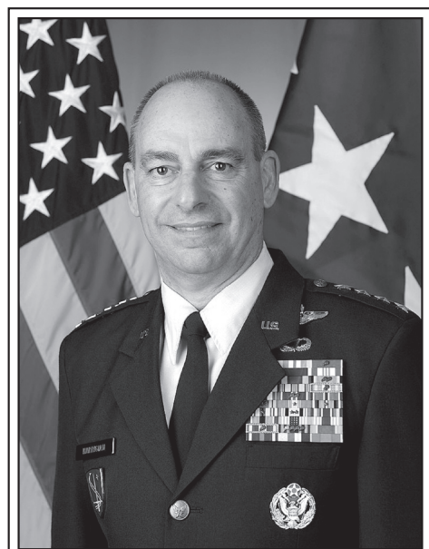
Американский генерал ВВС Джеффри Харригян

Впрочем, не секрет, что среди армян есть такие, что спят и видят расколотый Иран. И это далеко не Харригяны. Это обычные армяне в самой Армении и на постсоветском пространстве. Как правило, люди они недалёковидные и плохо разбирающиеся в политике. Им мерещится, что иранский народ пребывает в мучении во власти мулл, а Иран нуждается в демократических преобразованиях. Похвально! Только следует учесть немаловажный факт: что в Европе хорошо, то на Ближнем Востоке хаос. Тем более что эти самые «демократические преобразования» наглядно нам продемонстрировали в Ливии и Ираке те же Соединенные Штаты. Подобные «преобразования» в Иране могут жестоко ударить по Армении. В отличие от Ирака и Ливии, не имеющих общих границ с Арменией, Иран был и остается надежным и добрым соседом.