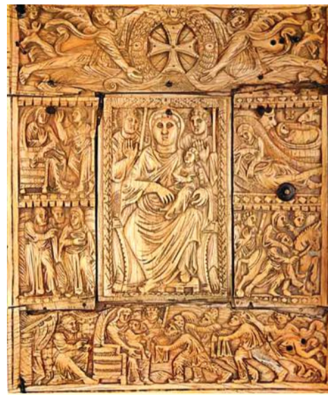
Էջմիածնի Ավետարանի փղոսկրյա կազմը, 6-րդ դար

շենքի մակերեսը կազմեց 11,358 քմ, ինչը երեք անգամ գերազանցեց հին համալիրի մակերեսը: Այն նախատեսված է գիտա-հետազոտական գործունեության, ձեռագրերի, արխիվային փաստաթղթերի և ֆոն-