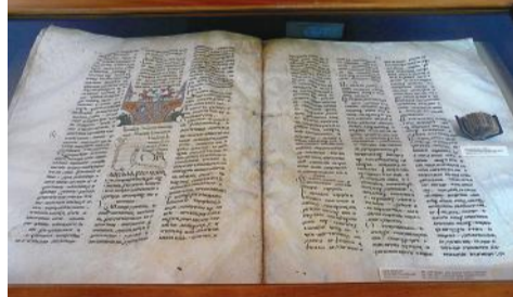
Մշո ճառքնոցը՝ ամենամեծ և Տոնացույցը, 15-րդ դար ամենափոքր ձեռագիրը

Մեր վիճակագրական համալսարանի շենքի ճակատային հատվածում տեղադրված հայ միջնադարյան գրականության, արվեստի, գիտության մեծ գործիչներ Թորոս Ռոսլինի, Գրիգոր Տաթևացու, Անանիա Շիրակացու, Մովսես Խորենացու, Մխիթար Գոշի և Ֆրիկի արձանները, իսկ ներքևի փոքրիկ հրապարակում Մեսրոպ Մաշտոցի և նրա աշակերտ Կորյունի արձանախումբը: Ցուցադրեց նաև մուտքի մոտ գրված հայերեն թարգմանված առաջին նախադասությունը. «Ճանաչել գիմաստությունն եւ զկրատ, իմանալ զբանս հանճարոյ»: