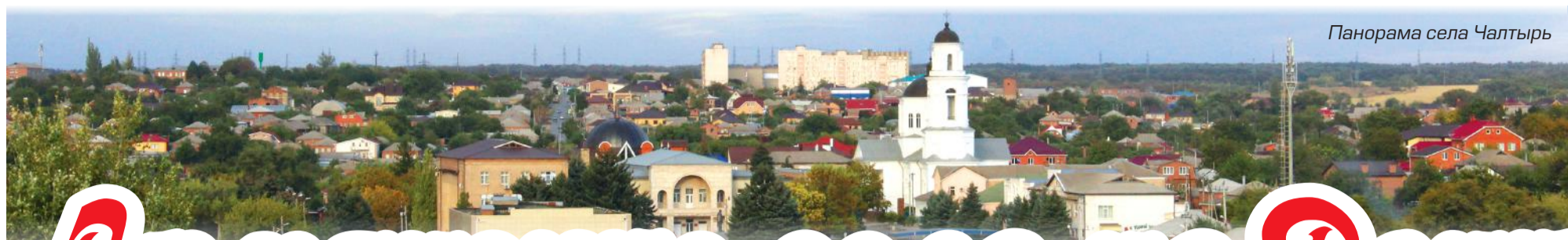
Панорама села Чалтырь