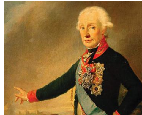
Александр Васильевич Суворов

дов. Многие армянские купцы по своим торговым делам имели деловую связь с населенными пунктами Южной России и, конечно, не прочь были переехать в новые края и здесь широко развернуть свое коммерческое дело. Ведь армяне страшно боялись, что турецкий султан вытеснит русских из Крыма. Слухи о переселении христианского населения Крыма дошли до хана и его мурз. Хан был в бешенстве. Он требовал разъяснений от российского правительства, лично от А.В. Суворова. Официальные