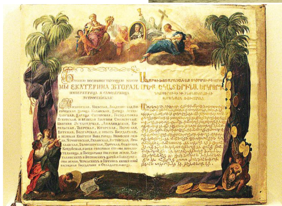
Указ Екатерины II

Причиной, побудившей российское правительство организовать переселение армян и греков, было стремление поскорее положить начало колонизации тогда еще безлюдного Новороссийского края.