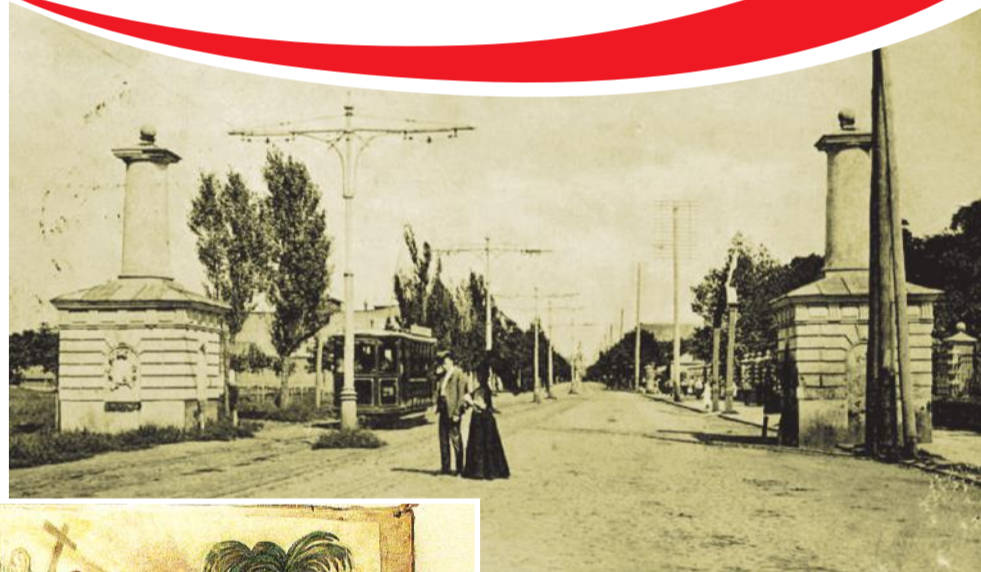
Граница, разделяющая города Нахичевань и Ростов

Что касается Нахичевани, то граница между двумя городами – Ростовом и Нахичеванью – всегда была и считалась чисто условной. К началу двадцатых годов прошлого века в донской столице проживали в общей сложности более 350 тысяч человек. И вполне закономерным стало правительственное решение, которым оба города были объединены в один – Ростов-на-Дону. 28 декабря 1928 года разделительная черта, проходившая по Театральной площади, перестала существовать, а в 1929 году на территории Нахичевани был образован Пролетарский район, один из крупнейших в городе.