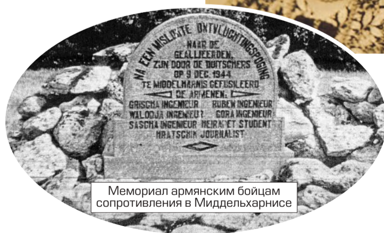
Мемориал армянским бойцам сопротивления в Миддельхарнисе

Об армянах-купцах голландского средневековья осталось много свидетельств в амстердамских музеях, на картинах в которых изображены эти самые предприниматели. Их запечатлели Йоханнес Лингельбах на Gezicht op de Dam (1656 г.), Дж. Шульц «Армянский купец» (17 в.), Каспар Нэтшер «Молодой армянин, склонившийся к окну» (1639 г.)... А в Национальном голландском государственном музее хранится скульптура «Армянский торговец с обезьяной», инкру-