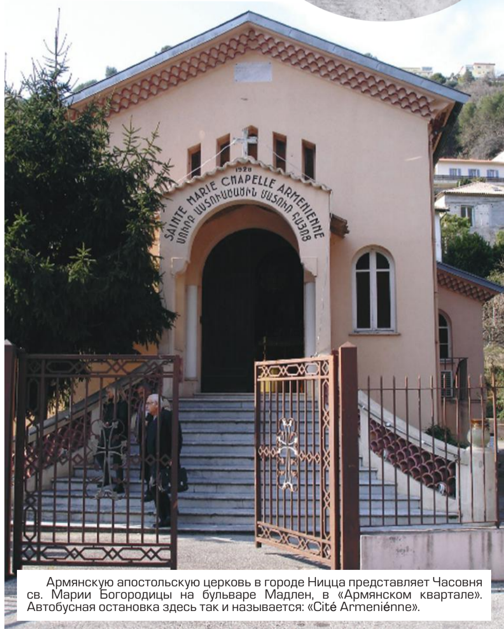
Армянскую апостольскую церковь в городе Ницца представляет Часовня св. Марии Богородицы на бульваре Мадлен, в «Армянском квартале». Автобусная остановка здесь так и называется: «Cité Arméniénne».