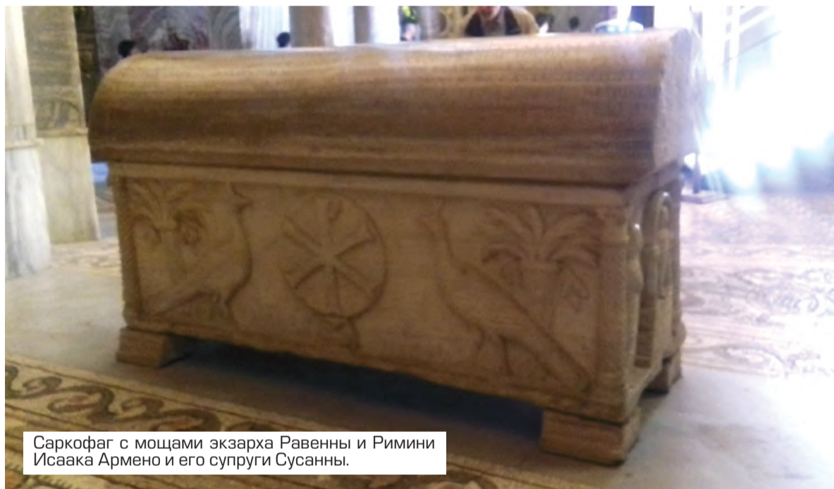
Саркофаг с мощами экзарха Равенны и Римини Исаака Армено и его супруги Сусанны.