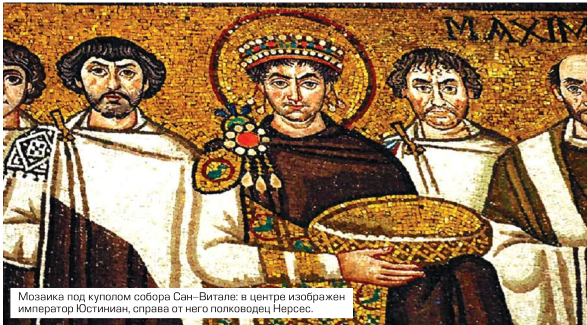
Мозаика под куполом собора Сан-Витале: в центре изображен император Юстиниан, справа от него полководец Нерсес.

От молодых людей, внешне не похожих на итальянцев, сильно разило алкоголем. Впрочем, как и от их подруг. Между собой все они говорили по-английски. Явно гастарбайтеры и находятся в Италии не больше года. Поэтому отель Colombo им не был знаком, но все четверо согласились помочь мне в поисках. По пути мы познакомились. Оказалось, что ребята из Бангладеш. Трудятся в Венеции почти полгода, убирая мусор, чтобы отправить деньги на родину. А девушки, их подружки, студентки из Боснии. Во всяком случае, сами боснячки так представились. Так, в компании и разговорах, нам удалось –таки разыскать Colombo. Распрощавшись с моими помощниками, я стал звонить в дверь частного отеля. Навстречу мне вышел сам хозяин. Он предстал передо мной в домашнем халате и