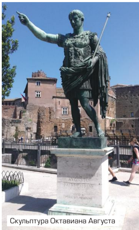
Скульптура Октавиана Августа

храма хоть и на армянскую тематику, но само строение в стиле римской архитектуры. Проходя мимо, не сразу можно узнать в храме типичную армянскую церковь. Но стоит войти, видишь, как армянские христианские мотивы тесно переплетаются с католическими.