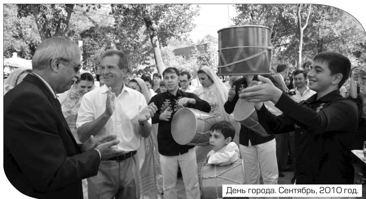
День города. Сентябрь, 2010 год.

Ведется строительство новых храмов в городах Шахты и Новочеркасск.