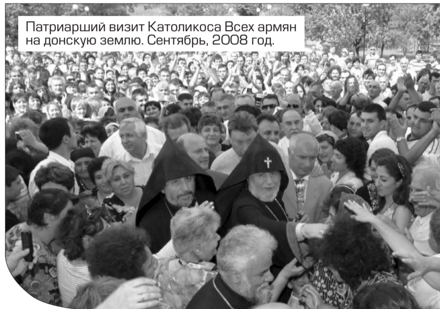
Патриарший визит Католикоса Всех армян на донскую землю. Сентябрь, 2008 год.