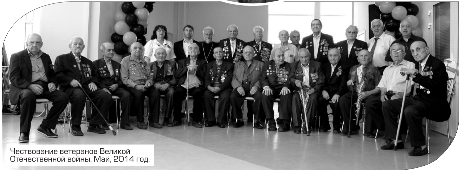
Чествование ветеранов Великой Отечественной войны. Май, 2014 год.

– Отремонтированы и действуют пять армянских церквей.