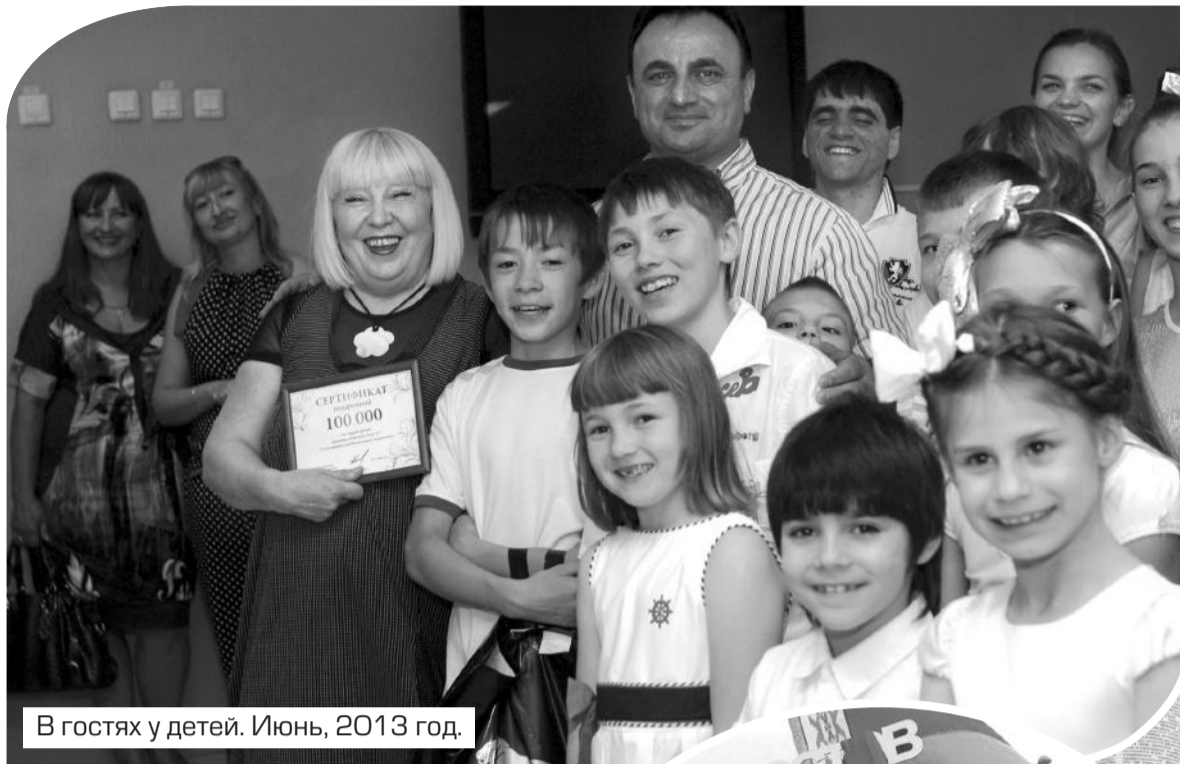
В гостях у детей. Июнь, 2013 год.

– Детский дом № 7. РРОО «Нахичеванская-на-Дону армянская община» уже много лет шефствует над ростовским детским домом № 7. Общине небезразличны судьбы ребят, нуждающихся в дополнительном внимании взрослых. Регулярно детскому дому оказы-