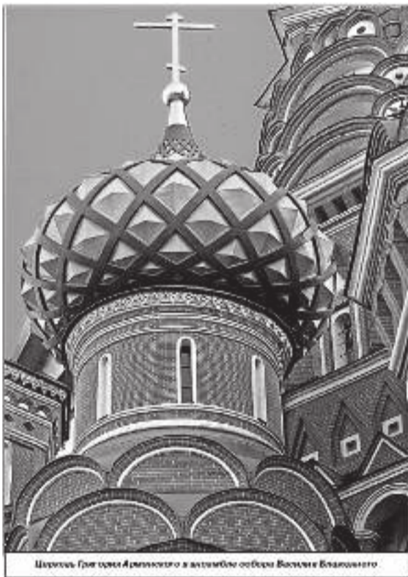
Церковь Святого Армянского в интерьере собора Василия Блаженного

Думаю, о Великой отечественной войне и говорить не приходится, учитывая армянских маршалов, генералов и Героев СССР. Армянам так много лет и так много славных страниц у этого народа, что трудно их с кем-либо столкнуть. Тем более с исконными соседями, тем более с Россией. Это важно понимать.