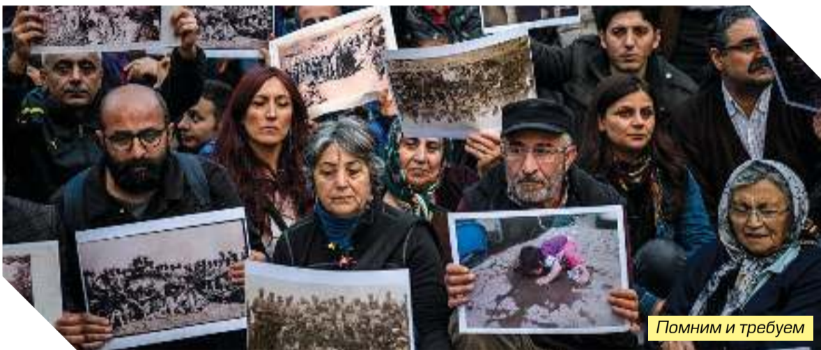
Помним и требуем