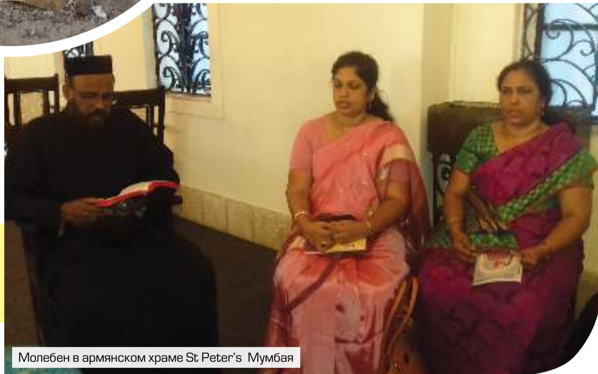
Молебен в армянском храме St Peter's Мумбаи