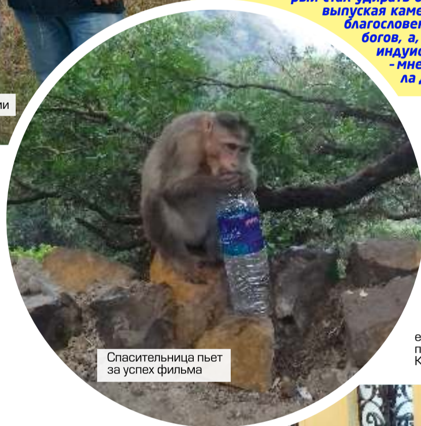
Спасительница пьет за успех фильма