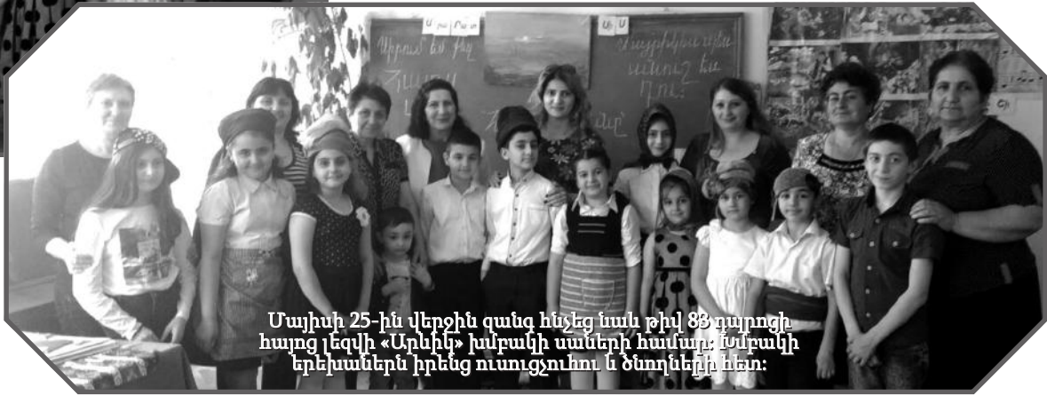
Մայիսի 25-ին վերջին գանգ հինգեց նաև թիվ 83 դպրոցի հայոց լեզվի «Արևիկ» խմբակի սաների համար: Նմանակի երեխաներն իրենց ուսուցչուհու և ծնողներին հետ:

- Բարի երթ, սիրելի շրջանավարտներ: Աշխարհի որ ծայրում էլ լինենք, ինչ ազգի էլ պատկանենք, մի կարևոր առաքելություն պիտի ունենանք բոլորս. այս մոլորակը դարձնել էլ ավելի լավը խաղաղ ու անվտանգ: Բարի երթ նաև ձեզ, իմ սիրելի հայ շրջանավարտներ, շնորհավոր ձեր սուտըր մեծ կյանք,