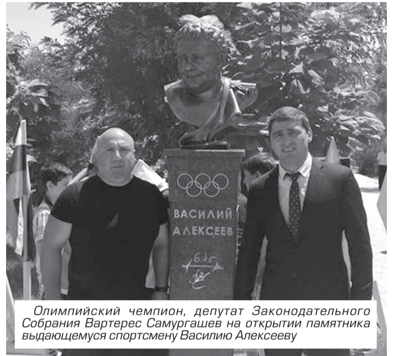
Олимпийский чемпион, депутат Законодательного Собрания Вартерес Самургашев на открытии памятника выдающемуся спортсмену Василию Алексееву

Министр иностранных дел Армении Эдвард Налбандян выразил надежду, что установка памятника Василию Алексееву в Армении в городе Армавире