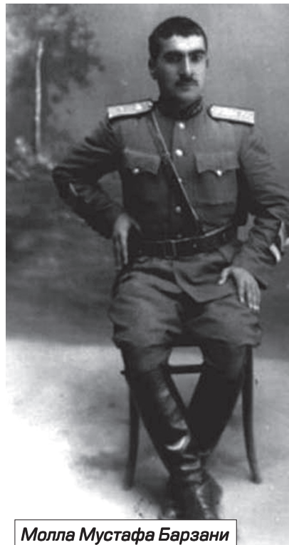
Молла Мустафа Барзани

Надо также заметить, что курды оказались разменной монетой и в Восточной Армении. К примеру, дабы ослабить армянских меликов Нагорного Карабаха путем отделения их от основных армянских территорий, персидские шахи из династии Сефевидов переселили курдские племена в район, расположенный между Нагорным Карабахом и Зангезуром. Об этом пишет и академик Виктор Шнирельман в книге «Войны памяти». А в 1923 г. указом Президиума Центрального исполнительного комитета (ЦИК) Азербайджанской ССР был образован Курдистанский уезд, т. н. Красный Курдистан в том же Лачинском коридоре, чтобы образовать курдскую стену между Армянской ССР и армянонаселенным Нагорно-Карабахским автономным округом. Правда, идея эта просуществовала шесть лет, и в 1929 году Красного Курдистана не стало. Зато и сегодня имеются настроения среди курдов постсоветского пространства о возрождении этого, как они называют, «Кавказского Курдистана». Имеются даже свои лидеры и бумагомаратели в лице некоего Вакила Мустафаева, издавшего книгу «История Кавказского Курдистана» с претензией чуть ли не на все страны Закавказья.