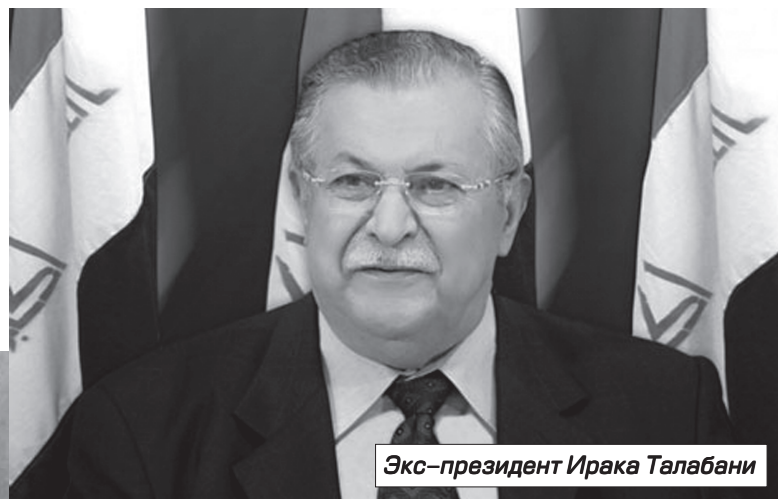
Экс-президент Ирака Талабани

взгляды. К тому же надо заметить, что из всех исламских народов Ближнего Востока курды менее религиозны. Если они и вершат революции, то не во славу уммы, не во славу ислама, а скорее во славу нации. Но беда в том, что курды, как я говорил, и в собственной нации раздроблены. Пример тому современный Ирак, в котором уже имеется не только курдская автономия на севере страны, возглавляемая Масудом Барзани, но и сам Ирак, президент которой Мухаммед Хаврами также является этническим курдом. Но между главами Ира-