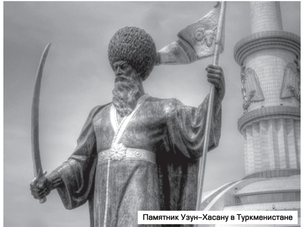
Памятник Узун–Хасану в Туркменистане

В 1467 г. правитель Кара Коюнлу Джихан–хан двинулся с большим войском в Армению. На Мушской равнине произошло решительное сражение, в котором войско Кара–Коюнлу было разбито Узун–Хасаном и понесло большие потери. Туркмены Ак Коюнлу стали преследовать Джихан–хана, отступавшего из Армении в Иранский Азербайджан, и нанесли ему еще одно поражение в одном из горных ущелий. Джихан–хан пал в бою. В следующем году Узун–Хасан вторгся в Иранский Азербайджан и близ Маранда рассекл остатки Кара Коюнлу, возглавляемые сыном Джихан–хана, Хасан Али. В последующие годы Узун–Хасан отвоевал у Тимуридов почти весь Иран, кроме Хорасана и При-