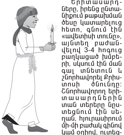
Երիտասարդները, իրենց ընտանիքում թաթախման ծեսը կատարելուց հետո, գնում էին «ավետիսի տունը», այնտեղ բաժանվելով 3-4 հոգուց բաղկացած խմբերի, սկսում էին ման գալ տներուն և շնորհավորել Քրիստոսի ծնունդը: Շնորհավորող երիտասարդներին տան տերերը նրբաբարեկցում էին սեղանի, հյուրասիրում մի-մի բաժակ գինով կամ օղիով, ունեց-

Քրիստոսի ծնունդը: Դա մի պարտադիր սովորություն էր, Սուրբ Ծննդյան տոնակատարության անբաժան մասը: Ժողովուրդը նախօրոք պատրաստություն էր տեսնում «ավետիսի տոնը» ընդունելու համար: Ամեն մի տուն մասնավորապես նրանց համար թխում էր մեծ խալածներ և գաթաներ՝ շարմուղուն այլուրից: