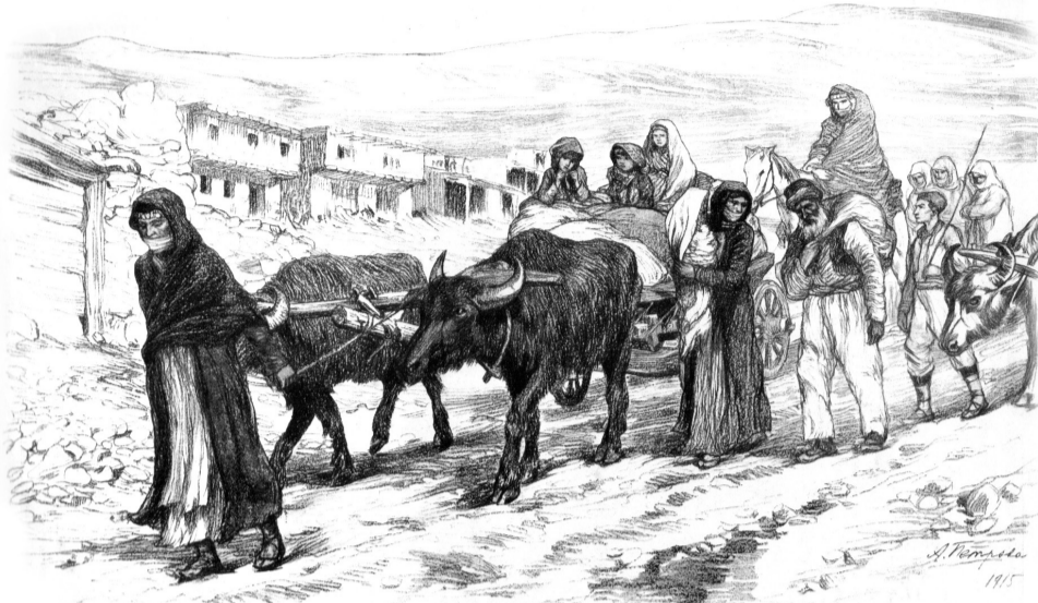
Армянские беженцы. (Рис. худ. А. Петров, собств. «Иллюстрация»)

манской империи. Немало беженцев было принято в Нахичевани–на–Дону и в Ростове.