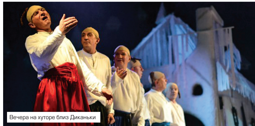
Вечера на хуторе близ Диканьки

Ростовчане давно не мыслят свой театр без ставшего уже традиционным старейшего в России Международного фестиваля для детей и молодежи «Минифест». Его история началась в 1989 году. В 1996 году Ростовский театр был выбран местом проведения XII Всемирного конгресса Международной ассоциации театров для детей и молодежи (АССИТЕЖ). Единствен-