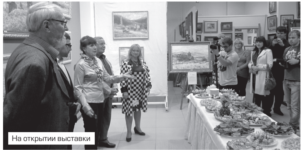
На открытии выставки

И вот персональная выставка – шаг в творческой судьбе необходимый и ответственный, который дает возможность зрителю увидеть и почувствовать, о чем думает автор, что его больше всего волнует и что может