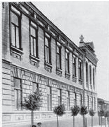
Гогоевская женская гимназия, 1877 г. Главный фасад. Фото начала XX в.