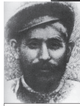
Виссарион Иванович Джугашвили – отец Сосо Джугашвили.