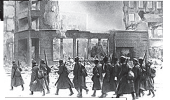
Ростов–на–Дону в годы войны.