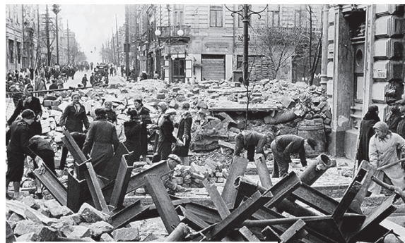
1941 год. Жители Ростова–на–Дону строят баррикады.

И нас действительно готовили к войне. Были организованы санитарные дружины и противовоздушная оборона. Нас обучали, как оказывать первую помощь пострадавшим, как пользоваться проти-