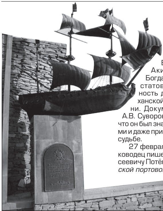
Надпись на табличке: 15 декабря 1749 года была основана Темерницкая таможенная, положившая начало городу Ростову-на-Дону.

15 декабря 1749 года императрица Елизавета Петровна издала указ о постройке вблизи урочища Богатый Колодезь пограничной таможи для взимания пошлин с товаров, привозимых из Турции и вывозимых за границу.