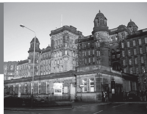
Королевский госпиталь в Глазго.

чилось это тем, что выпить водки меня стали уговаривать почти все посетители паба. И я сдался. Мне налили полстакана водки. Дети! Они не знали нашу русскую душу, и на что она может быть готова. Я выпил залпом, не закусывая и не запиная. Поставил стакан на стол и обвел победоносным взглядом всех присутствующих в пабе. Они были в восторге: визжали, аплодировали, кричали «браво». Я чувствовал себя национальным героем, который где-то на чужбине отстаивает честь своей страны. Мне налили еще полстакана водки, дальнейшее я помню плохо. Покинули это веселое местечко мы с Гарри под утро. Распростившись со своим новым другом, я присел на скамейку и заснул. Проснулся я от холода и сырости. Несмотря на то, что уже светало, густой туман не позволял мне понять, где я нахожусь. Когда же осматрелся, то к своему ужасу обнаружил, что нахожусь