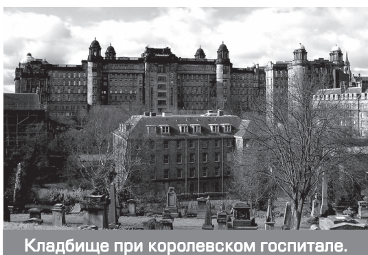
Кладбище при королевском госпитале.

лик стали подсаживаться какие-то друзья Гарри, угощать водкой и просить, чтобы я ее выпил. Вначале я отказывался, пытаясь объяснить бестолковым шотландцам, что пиво с водкой – это страшная сила, которая кого хочешь свалит с ног. Но то ли они плохо понимали мой английский, то ли они были убеждены, что все в России должны пить водку. Закон-